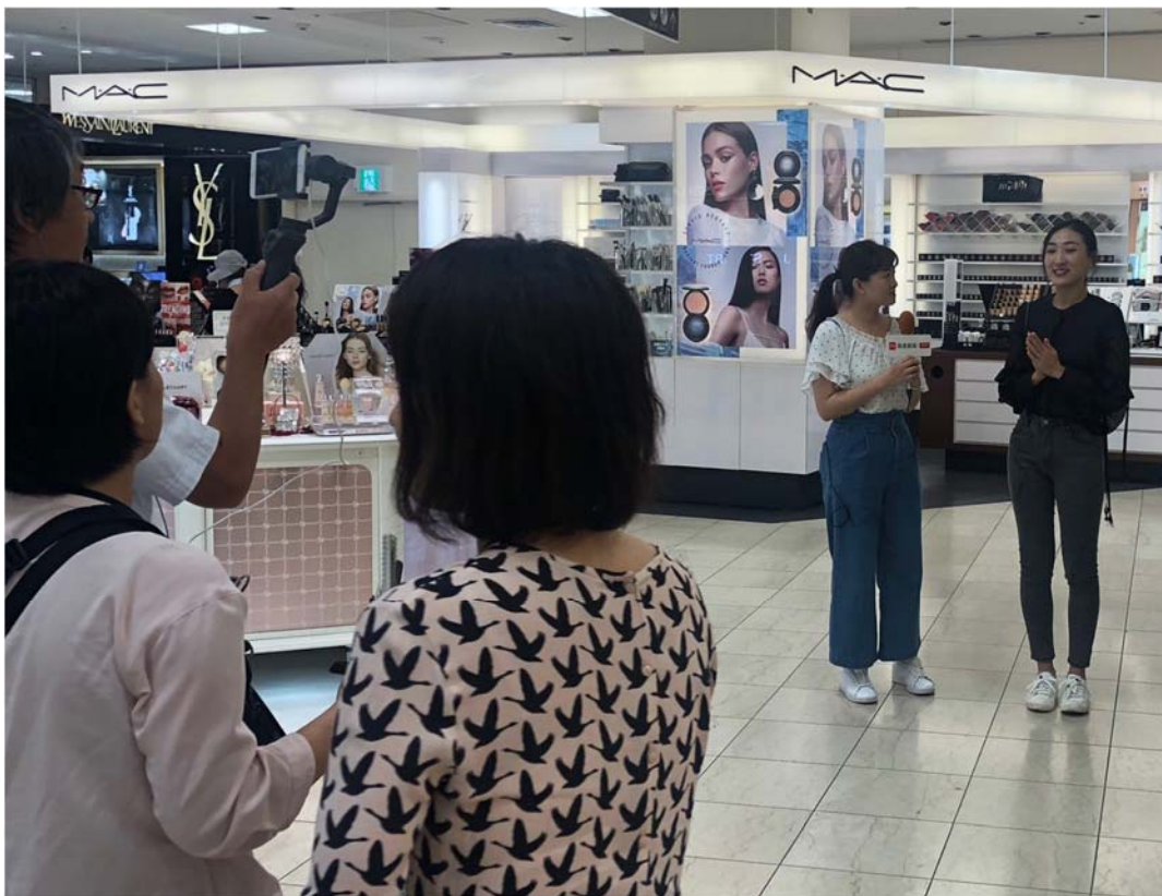
(大丸 福岡天神店様での生放送風景 2018年9月26日)